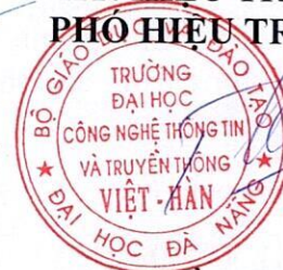
TS. Trần Thế Sơn